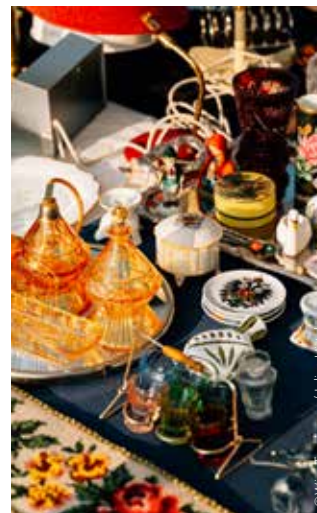
Flohmarkt am Naschmarkt Flea Market on the Naschmarkt

8.5. ◆ FEST DER FREUDE Open-Air-Konzert der Wiener Symphoniker zum Tag der Befreiung von der NS-Herrschaft Open-air concert of the Wiener Symphoniker on the day of liberation from Nazi rule 1., Heldenplatz, 19.30 www.festderfreude.at #free entry #openair