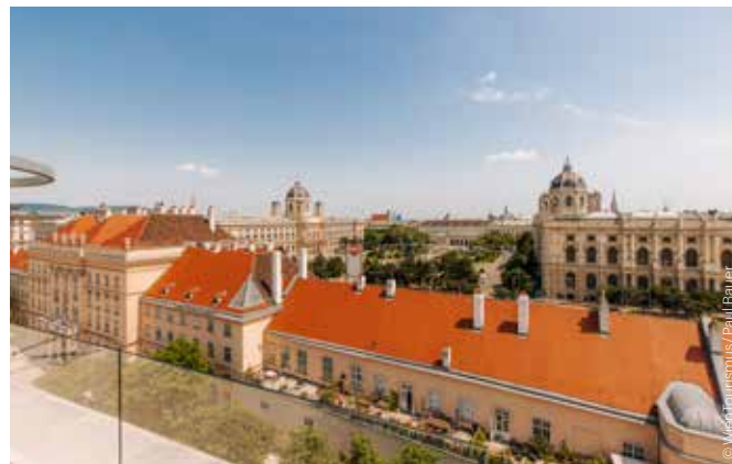
MuseumsQuartier, Kunsthistorisches und Naturhistorisches Museum Wien