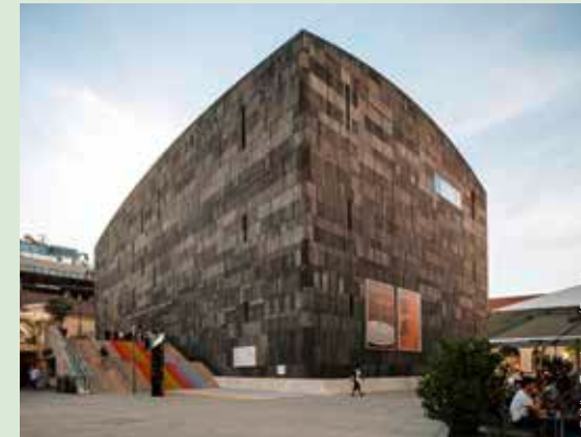
mumok – Museum moderner Kunst Stiftung Ludwig Wien mumok – museum of modern art ludwig foundation vienna

Kunst Haus Wien – famous for its colorful mosaics and uneven surfaces – in the Weissgerberviertel neighborhood in the 3rd district is a prime example of sustainability in action. In 2018, it became the first Viennese museum to achieve certification under the Österreichisches Umweltzeichen. Today, 17 of the city's museums bear this state quality seal. The Austrian Ecolabel logo was designed by Friedensreich Hundertwasser – the eco-pioneer whose philosophy defines the Kunst Haus. Created by remodeling the former Thonet furniture factory in 1991, it closed for six months while urgently-needed geothermal heating upgrades were carried out to make sure that the museum was fit for the future. The project improved energy efficiency levels by 75 percent. The foyer, café and store were also renovated and the permanent Hundertwasser exhibition completely redesigned.