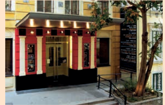
Vienna's English Theatre, Außenansicht Vienna's English Theatre, exterior view

It's impossible to imagine the capital's theater scene without Vienna's English Theatre. Besides classics of English and American