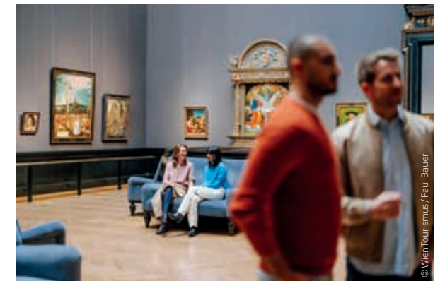
Kunsthistorisches Museum Wien