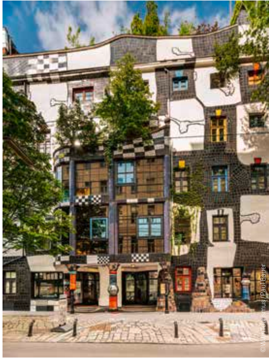
Kunst Haus Wien Museum Hundertwasser