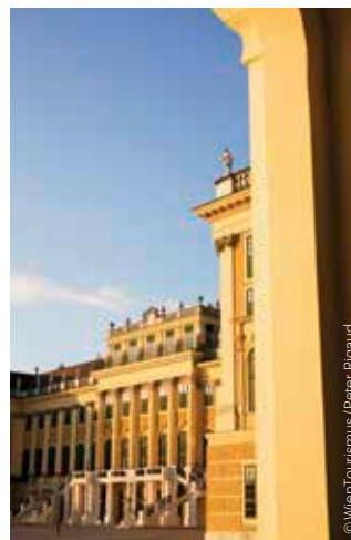
Schloss Schönbrunn Schönbrunn Palace

◆ DAS PHANTOM DER OPER Musical von A. L. Webber Premiere 15.3. Di, Mi / Tue, Wed 18.30 Do, Fr, Sa / Thu, Fri, Sat 19.30 So / Sun 14.00